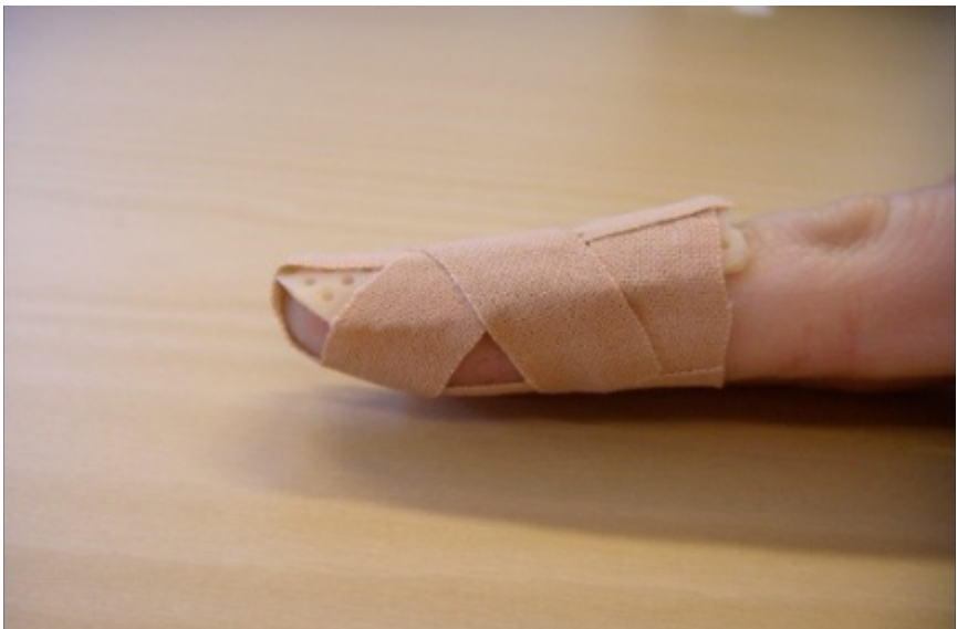
Exempel på ortos.

Ett exempel på en skena. Efter avslutad behandling kan det bli en liten kvarstående dropp tendens i fingrets ytterled.