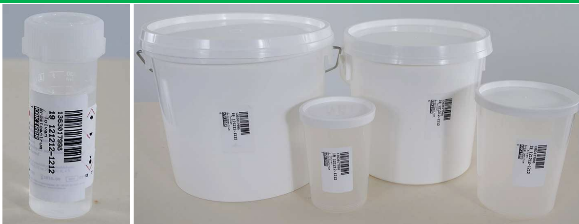
Vertikal etikett där streckkod är vänd åt höger.