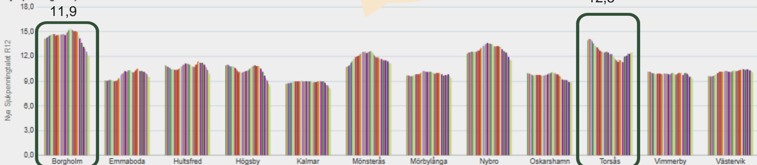
Sjukpenningtalet på kommunnivå

Bilden visar utvecklingen av Sjukpenningtalet 1.0 2022 och framåt. Försäkringskassans mål är att bidra till låg och stabil sjukfrånvaro.