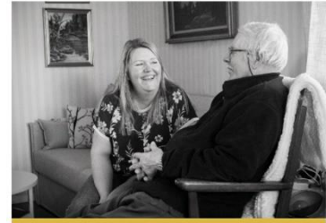
Samordnade grupp Äldre

Den äldre ska erbjudas förebyggande och hälsofrämjande insatser för ett fortsatt aktivt liv samt kunna åldras och möta livets slutskede i trygghet med tillgång till god vård och omsorg. Det individuella behovet styr insatsen och äldres psykiska hälsa ska särskilt beaktas.