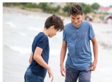
Samordnande grupp Barn och unga

En tidig, nära och sammanhållen vård ska erbjudas till familjer och barn som har behov av samhällets stöd och där det individuella behovet styr utformandet av insatsen.