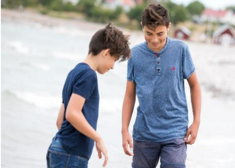
Samordnande grupp Barn och unga