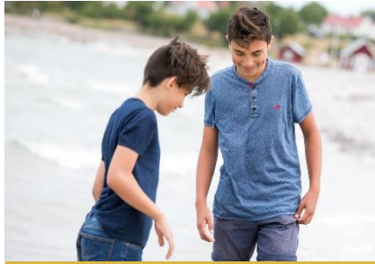
Barn och unga