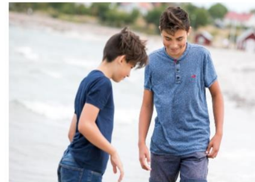
Samordnande grupp Barn och unga

Ska leda till att utifrån barnet i sitt sammanhang, främja god och jämlik hälsa för hela familjen genom att familjecentralerna erbjuder hälsofrämjande och förebyggande insatser av god kvalitet och god tillgänglighet.