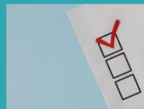
Vägledning i enkätfrågor